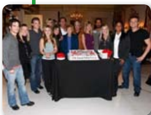
IL CAST DELLA SOAP