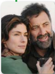
VALLE E BARBARESCHI