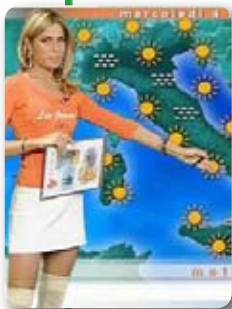
IL METEO DEL TG4