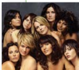
IL CAST DI The L Word