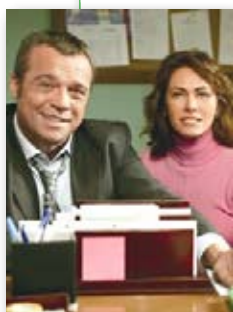
AMENDOLA & RICCI

Premesso che nella televisione italiana passano cose peggiori de "I Cesaroni", risulta abbastanza incomprensibile l'elevato consenso di cui gode la serie di Canale 5. Si dirà: dov'è la novità? In passato c'era già stato il caso di "Un medico in famiglia", mogul di ascolti ma prodotto nazional-popolare scritto e recitato in modo approssimativo. La novità risiede nell'esposizione mediatica di cui fruiscono i (presunti) contenuti de "I Cesaroni". "Un medico in famiglia" fece scalpore soprattutto per l'addio di Claudia Pandolfi e Giulio Scarpati dopo la seconda serie e per la lettura