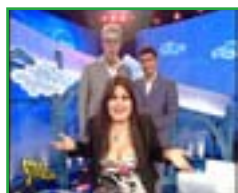
IL TRIO DI "STRISCIA"

Altro che guerra degli ascolti. Dietro il tanto dibattuto calo di audience di "Striscia la notizia", a vantaggio del programma Rai di Paolo Bonolis, si cela una scelta precisa. Per due motivi, ha spiegato Antonio Ricci nella conferenza stampa organizzata per presentare i nuovi conduttori del tg satirico di Canale 5: riportare "Striscia la notizia" a livelli di ascolti più appetibili anche per i pubblicitari e garantire un successo alla Rai del centro-destra targata Del Noce-Cattaneo. "Noi lo diciamo da anni - ha esordito Ricci - 'Striscia la notizia' non dovrebbe superare i 7.200.000 spettatori; anche per tutelare le altre reti del gruppo dal punto di vista pubblicitario". Inoltre, il rivale "Affari tuoi" sarebbe stato favorito dalla stessa Mediaset.