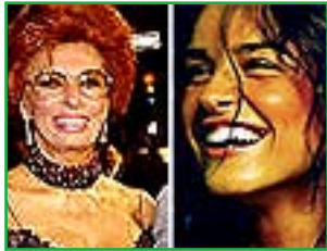
SOPHIA LOREN-KASIA SMUTNIAK

Chissà quanti cinefili si saranno accorti di come in questi giorni il mondo della pubblicità abbia "desacralizzato", reso alla stregua di una barzelletta, uno dei momenti più significativi ed emozionanti legati al cinema italiano. Alludiamo allo spot di un noto gestore di telefonia, in cui Sophia Loren fa il verso a se stessa. Nella realtà, correva l'anno 1999, la Loren consegnava l'Oscar a Benigni, accompagnando il gesto con il famoso urlo di gioia ("Robbeerto"). Nella odierna finzione per la pubblicità l'attrice ripete la stessa scena conferendo il premio al simpatico cane napoletano della saga