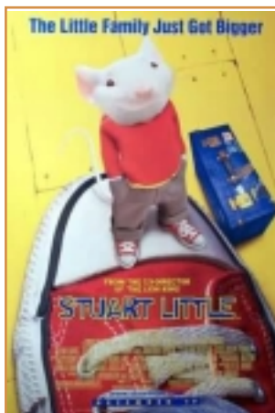
STUART LITTLE UN TOPOLINO IN GAMBA

E dopo il cappone del pranzo di Natale, ecco arrivare le galline: nella prima serata del 25 dicembre Raiuno schiera infatti il divertente film di animazione "Galline in fuga" del 2000, diretto da Nick Park e Peter Lord, e in seconda serata punta sull'evergreen "Mary Poppins". Cinema anche per Canale 5, che prima ci commuoverà con "Miracolo nella 34a strada", poi ci diventerà con "Big", interpretato da un giovane Tom Hanks (era il 1988). Italia 1 invece chiama a raccolta i comici dello Zelig che, coordinati da Claudio Bisio e Michelle Hunziker, saranno protagonisti della serata speciale Zelig Christmas. Su Rete4 il film Tv "Il Natale di Poirot", mentre Tele+ punta su uno dei successi cinematografici dello scorso Natale: South Kensington di Carlo Vanzina, con Rupert Everett, che sarà seguito da uno speciale dedicato a "La leggenda di Al, John & Jack" e dai film "Fratello dove sei" con George Clooney e "La carica dei 102" con Glenn Close. Stream dedica la serata alle famiglie, con il film "Napoleone cucciolo pasticcione". Meno natalizie invece le prime serate del 25 dicembre su Raidue e Raitre che propongono, rispettivamente, lo spettacolo teatrale "Se devi dire una bugia, dilla grossa" dal Teatro Donizetti di Bergamo con Gianfranco Jannuzzo, Paola Quattrini, Fabio Testi e Anna Falchi, e il film "...e poi lo chiamarono il magnifico" con Terence Hill.