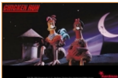
GALLINE IN FUGA

M entre Harry Potter e Aldo, Giovanni e Giacomo si contendono la sfida di Natale sul grande schermo, anche le emittenti televisive stanno ultimando la preparazione dei palinsesti del periodo festivo, sfoderando decisamente le unghie. Tra il 23 dicembre e il 6 gennaio vedremo in tv tante prime visioni, dedicate soprattutto ai più piccoli, ma anche grandi classici che tornano ogni anno a farci compagnia. Uno di questi, il cartone animato "Super Bunny in Orbita", quest'anno è già andato in onda sabato 14 dicembre, conquistando 2.800.000 spettatori, quasi l'11% di share: un buon risultato se si considera che i personaggi Warner Bros se la sono dovuta vedere con Gianni Morandi e il suo ospite d'eccezione Adriano Celentano e con la posta di Maria De Filippi. Un dato che dimostra che i classici più amati non perdono mai fascino, soprattutto in un periodo come quello natalizio.