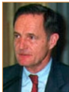
IL MINISTRO FRANCIS MER

Nel 2001 in Francia la larga banda è stata sfruttata dal 2,6% degli utilizzatori di internet, contro una media dell'Unione europea del 3,9% e di oltre il 10% della Svezia e degli Usa. Per superare questo gap il ministro dell'Economia Francis Mer ha annunciato che saranno adottate nuove politiche con l'obiettivo di portare da 1 a 10 milioni entro il 2005 il numero di navigatori, e di rilanciare il commercio elettronico attraverso transazioni più veloci e sicure. In particolare Mer ha spiegato che favorirà la concorrenza sugli accessi a banda larga, che ora è coperta per l'80% da Wanadoo, filiale di France Telecom. Sarà poi importante fare in modo che i francesi abbiano sempre più fiducia nel commercio elettronico, che oggi rappresenta poco più dell'1% delle transazioni. Il Governo francese intende inoltre spingere l'utilizzo della rete anche per le dichiarazioni dei redditi.