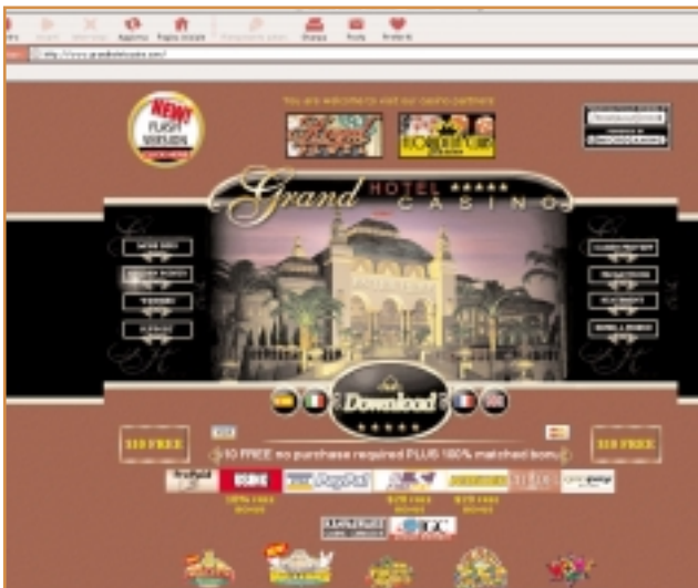
LA HOMEPAGE DEL WEBSITE WWW.GRANDHOTELCASINO.COM

La febbre da gioco si sta diffondendo dovunque e anche su questo tema internet sta diventando un media importante. Sono sempre di più i siti che offrono giochi d'azzardo oppure accettano scommesse online. Alcuni sembrano dei veri e propri casinò, con tanto di tavolo da gioco e croupier virtuale. L'offerta dei giochi è vasta, dalla roulette al black jack, il poker, le slot machine, il keno e il baccara. Ce n'è davvero per tutti i gusti. La posta in gioco è alta, o almeno può diventarlo, visto che non si tratta di soldi virtuali, ma di veri e reali quattrini. Si paga con carta di credito, e le vincite vengono accreditate sempre sulla carta di credito o trasferite direttamente sul conto corrente. Il tutto è assolutamente sicuro, o almeno così garantiscono gli ideatori di diversi siti. Nessun rischio, a