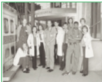
IL CAST DI "E.R."

Nella settimana del trionfo del commissario Montalbano (quasi 10 milioni di telespettatori su Raiuno lunedì 28 ottobre), giungono altri segnali incoraggianti dal mondo della fiction straniera e italiana. La grande sorpresa della stagione è rappresentata dal successo del telefilm "CSI: Crime Scene Investigation". Italia 1 , che in passato aveva "bruciato" importanti serie americane con scelte di palinsesto poco oculate (ricordiamo l'odissea di "Party of Five" e di "Picket Fences"), questa volta pesca il jolly e impone il