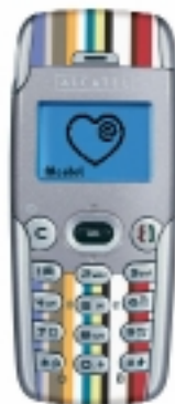
ONE TOUCH 525

Il nuovo telefono cellulare della casa francese unisce le caratteristiche che hanno segnato il successo di One Touch 511 e 311. Il terminale è leggero (pesa solo 77 grammi) e compatto, con antenna integrata, con tecnologia GPRS classe 6. E' inoltre disponibile un'ampia gamma di frontalini intercambiabili. Tramite alcuni tasti a funzione diretta, si possono impostare determinate funzioni in pochi secondi. One Touch 525 contiene tre giochi, oltre a immagini, animazioni, suonerie ed effetti sonori (come fischi e risate) che possono anche essere scaricati dal nuovo sito www.my-onetouch.it . La batteria ha una durata di sei ore in conversazione e 280 ore di stand-by. Il telefono è già in vendita al prezzo di 169 euro.