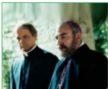
UNA SCENA DI "DON MATTEO"

Sacerdoti nel ruolo d'investigatori, fiction dedicate ai santi, la sfarzosa diretta per la canonizzazione di Padre Escrivà. Senza dimenticare gli ecclesiastici-opinionisti e la Santa Messa trasmessa pure da Mediaset...per quanto in Italia, per motivi storico-culturali, possa essere ancora forte il condizionamento del cattolicesimo, non era certo facile ipotizzare per l'anno 2002 un tale "menù" televisivo. Malgrado i cambiamenti profondi cui è andata incontro la società italiana negli ultimi decenni, molte delle odierne strategie televisive sembrano ispirate a un gusto per il bigotto e il melodramma, di tipica estrazione cattolica, che fanno pensare a un'involuzione perfino rispetto all'epoca in cui la Democrazia Cristiana dettava i temi per l'unica rete Rai visibile. Negli anni '60 e '70 la Rai proponeva grandi sceneggiati