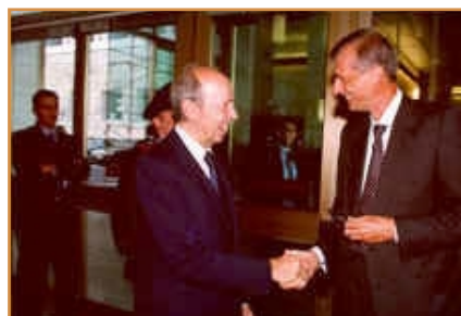
LAMBERTO DINI E PIERO FASSINO

che quei soldi finirono nelle casse di Milosevic e l'ambasciatore successivamente trasferito da Belgrado a Cipro.