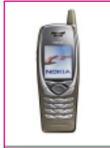
IL NOKIA 6650

Il produttore finlandese ha presentato nei giorni scorsi un nuovo telefono cellulare compatibile con il 3GPP (Third Generation Partnership Project) che funziona sulle frequenze GSM 900/1800 e sul protocollo WCDMA (Wideband Code Division Multiple Access). Il modello Nokia 6650 consente di svolgere più sessioni dati contemporaneamente: è così possibile catturare e condividere ciò che l'utente vede mentre parla al telefono. Il cellulare funziona sia in Europa sia in Asia, Giappone compreso. Le prime consegne inizieranno nel quarto trimestre 2002 per effettuare i test di rete dal vivo controllati dall'operatore. Il lancio commerciale è previsto per la prima metà del 2003. Il cellulare ha un grande display a colori e camera integrata.