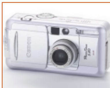
UNA FOTOCAMERA DIGITALE CANON

A ppassionati di fotografia o di informatica, o più semplicemente turisti che vogliono dire addio al rullino: le macchine fotografiche digitali stanno riscuotendo ampio successo presso diverse tipologie di consumatori, coinvolgendo anche i più restii alle nuove tecnologie. I prezzi delle apparecchiature cominciano ad abbassarsi e i vantaggi di questi gioielli tecnologici sono numerosi: ad esempio, la maggior parte dei modelli è dotata di un piccolo schermo che consente la preview delle immagini, in modo da poter eliminare subito gli scatti indesiderati; la memoria delle macchine contiene poi molti più scatti di un rullino, senza contare la possibilità di trasferire le immagini su un computer lasciando libero lo spazio sulla memory card dell'apparec-