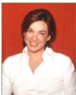
DARIA BIGNARDI CONDUTTRICE DI "LANDO"

Su Daria Bignardi, in quanto personaggio televisivo, si possono affermare tante cose con il massimo rispetto, negative o positive secondo canoni di giudizio soggettivi. Ma senza ombra di dubbio lei è una tra le rare donne del piccolo schermo a essersi imposta grazie alla spiccata personalità, a un grado di cultura eccellente, e non nozionistico, e alla continua "curiosità" intellettuale. Il suo è un look elegante, ma con poche concessioni al glamour (se si esclude una certa propensione a sfoggiare, nelle foto posate, dei sandali abbastanza provocanti, degni di quelli calzati da una "Elenoire" o "Alessia" qualsiasi del tubo catodico). L'ultima coraggiosa sfida di Daria si chiama "Lando", rotocalco-talk show partito martedì 21 maggio, nella tarda serata di Italia 1, con l'obiettivo di parlare di libri, per quattro puntate, in