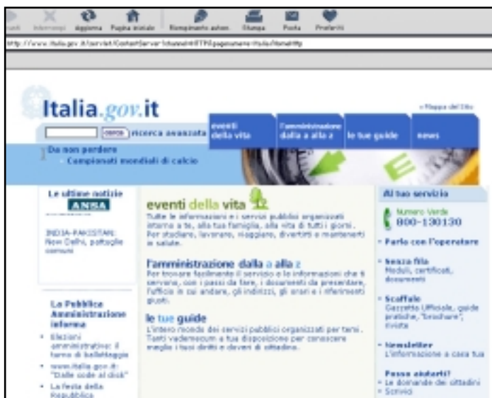
L'HOME PAGE DEL PORTALE DI P.A. WWW.ITALIA.GOV.IT

Il ministro per l'Innovazione e le Tecnologie, Lucio Stanca, ha prorogato la scadenza per la presentazione dei progetti di e-government a mezzogiorno di lunedì prossimo, 10 giugno. Nell'ultima riunione dei rappresentanti del sistema delle autonomie locali, gli esponenti delle regioni avevano chiesto di spostare di alcuni giorni il termine previsto per la consegna dei progetti, allo scopo di completare le attività di coordinamento necessarie alla presentazione degli elaborati. L'informatizzazione e digitalizzazione della P u b b l i c a Amministrazione italiana sembra dunque essere sulla linea di partenza. Il piano di e-government redatto dal Ministero prevede che ogni comune diventi parte di un back office virtuale in cui tutte le P.A. siano collegate alla Rete Nazionale. Grazie alla connessione dei computer in rete ci sarà una sorta di archivio condiviso che permetterà di gestire i registri anagrafici