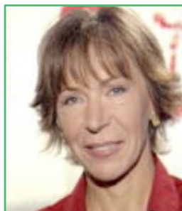
MILENA GABANELLI CONDUTTRICE DI REPORT

dei potenziali telespettatori. Con tanti saluti a coloro che rimangono davanti alla televisione... A sorpresa, dopo un'orgia di repliche di film stagionati, di cartoni animati per i piccini, e di programmi "in famiglia" prodighi di consigli pasquali (culinari, in particolare), abbiamo infine trovato conforto nella seconda serata della domenica di Pasqua: Raiuno, Raitre e Canale 5 hanno seguito la loro tradizionale linea di palinsesto e sono andati in onda con i tre appuntamenti di approfondimento-inchiesta ("TvSette", "Report", e "Terra!", rispettivamente). Ci solleva anche constatare che gli ascolti, come si evince dalla specifica tabella che pubblichiamo, sono stati positivi. E' significativo, in particolare, il risultato ottenuto da "Report", sempre condotto dalla bravissima Milena Gabanelli: 1.312.000 utenti rappresentano per Raitre, e per un programma "di nicchia", un ottimo dato. E a proposito di bravi conduttori, chiudiamo la rubrica ricordando un amico di "Broadcast&Video" scomparso la settimana scorsa: il carisma e la simpatia che caratterizzavano Daniele Vimercati sono le qualità che ogni analista di televisione vorrebbe incontrare lungo la propria strada.