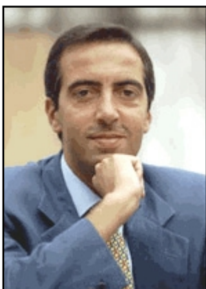
IL MINISTRO MAURIZIO GASPARRI

Bretagna o in Spagna, dove il digitale terrestre è a pagamento e fa concorrenza alla tv via cavo e quella satellitare, l'Italia ha scelto di sostituire un sistema, quello analogico, con un altro, quello digitale. La televisione manterrà quindi il carattere di universalità che ha oggi, raggiungendo gratuitamente tutte le famiglie".