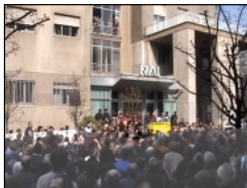
LA MANIFESTAZIONE DAVANTI ALLA RAI DI MILANO

blema non è la buona fede del governo nella gestione della Rai, ma la condizione inaccettabile che tutti principali canali televisivi siano sotto il controllo della stessa persona. Anche se si trattasse della persona più democratica e onesta del mondo. Il conflitto di interessi è un fatto oggettivo che può essere risolto solo garantendo il pluralismo con la cessione delle reti o del potere.