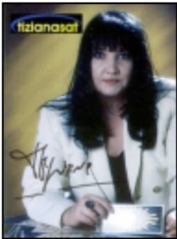
UN'IMMAGINE DA TIZIANASAT

P er quanto riguarda le fasce orarie mattutine siamo seguiti da un audience prevalentemente femminile, ma anche da molti uffici. Dopo le 22 vi è una grande predominanza maschile. I nostri programmi non danno alcuno spazio alla pubblicità, le fonti di introito del canale derivano dalle numerazioni audiotel, ovvero i prefissi a tassazione aggiuntiva, i famigerati 166. Tra i progetti di espansione più immediati vi è quello di