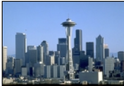
VISTA DELLA CITTÀ DI SEATTLE

mensili, controllata e gestita non da una compagnia ma dagli utilizzatori stessi", annunciava Matt Westervelt dal sito. In più di ottanta risposero all'appello. Una reazione entusiasta, ma prevedibile perché Seattle non è una città qualsiasi: oltre ad essere abitata da numerosi appassionati di tecnologie è da più di un secolo la città della controcultura, dei movimenti alternativi, delle organizzazioni sindacali radicali. Seattle è anche la città di Bill Gates, l'emblema del impero incontrastato delle multinazionali.