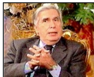
E' ON LINE LA SINTESI DEL LIBRO BIANCO SUL DIGITALE TERRESTRE DELL'AUTORITA' DI ENZO CHELI (NELLA FOTO): WWW.AGCOM.IT/PROVV/LIBRO_B_00/LIBROBIANCO00.HTM